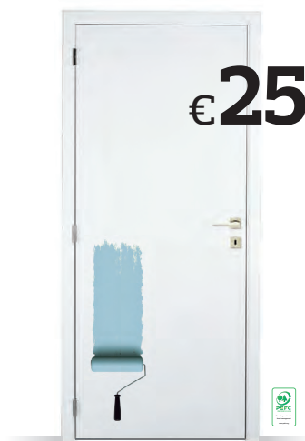
PORTE À PEINDRE AVEC TROU POUR SERRURE** - THYS Existe en largeur 68, 73, 78 ou 83 cm. Hauteur 201,5 cm. Porte livrée non finie. Ex. 83 cm. Ref. 2467122 € 25,00